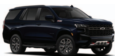
Azul Oscuro Metálico