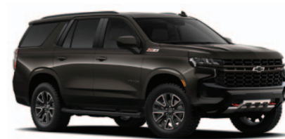
Gris Espresso Metálico