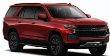
Rojo Burdeo Metálico