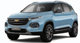
AZUL CIELO METÁLICO

*Equipamiento disponible según versión. GM Chile se reserva el derecho de hacer cambios o modificaciones en las especificaciones de sus modelos sin previo aviso.