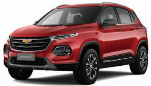
ROJO BURDEO METÁLICO