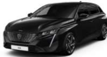
Perla Nera Black