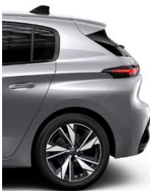
Allure 17' Alloy Calgary