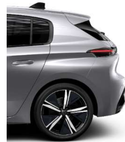
GT 18' Alloy Kamakura