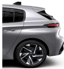
Allure Pack 17' Alloy Halong