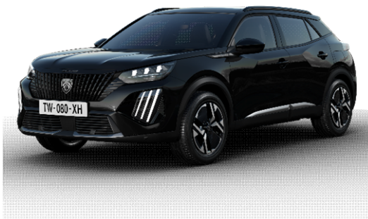
Perla Nera black