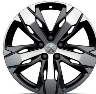
LOS ANGELES 18" Allure Pack /GT