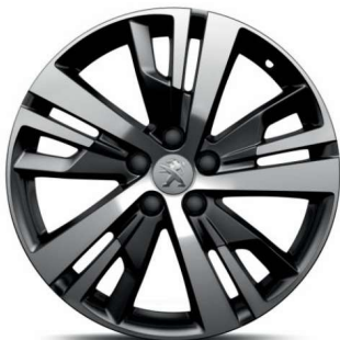
DETROIT 18" Active Pack