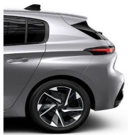
Allure EAT8 17' Alloy Halong