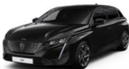
Perla Nera Black