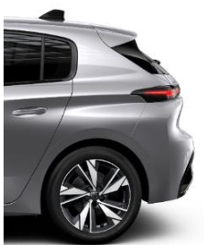
Allure MT6 17' Alloy Calgary