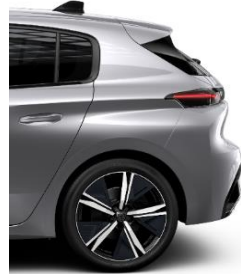
GT 18' Alloy Kamakura