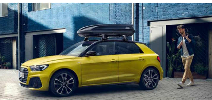
Barras de techo y Portaequipaje