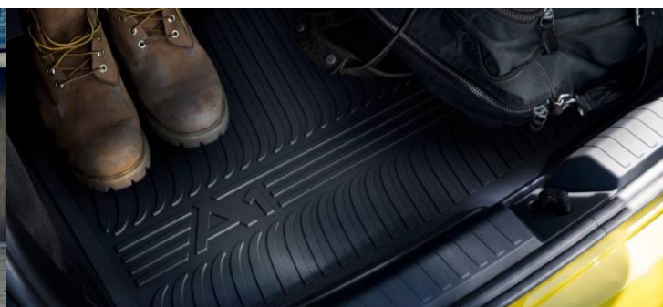
Pisos de goma y protección maletero