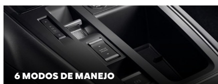
6 MODOS DE MANEJO