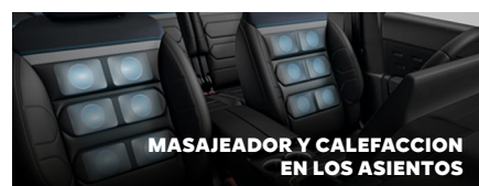
MASAJEADOR Y CALEFACCION EN LOS ASIENTOS