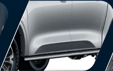
Pisaderas laterales integradas