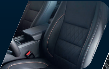
Asientos delanteros con calefacción