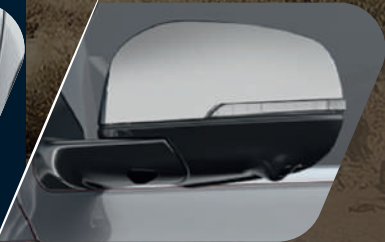
Espejos laterales eléctricos con luces direccionales