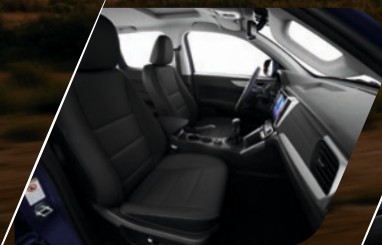
Asientos eco cuero