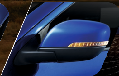
Espejos laterales eléctricos con luces direccionales