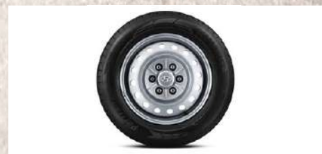
Aros de 17"