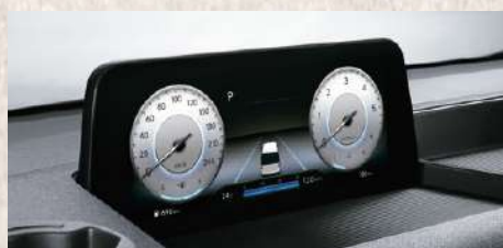
Tablero de Instrumentos de 10.25"