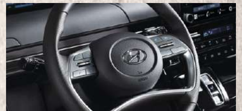
Timón forrado en cuero y con Paddle Shifters