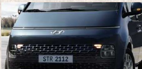
Nuevo motor 2.2 CRDi Diesel