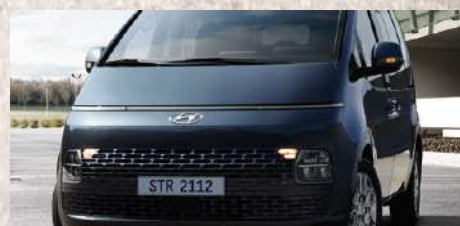
Nuevo motor 2.2 CRDi Diesel