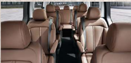
Capacidad para hasta 9 pasajeros