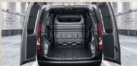
Más espacio de carga