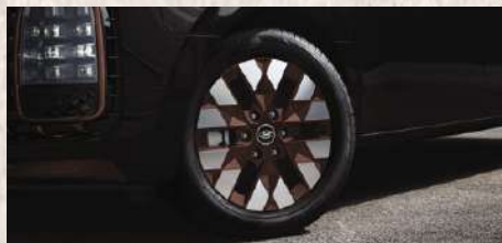
Llantas de aleación de 18"