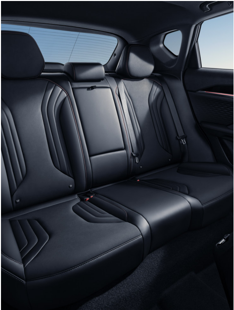
Asientos Traseros Confortables

Interior premium con pantalla de 14.6 pulgadas.