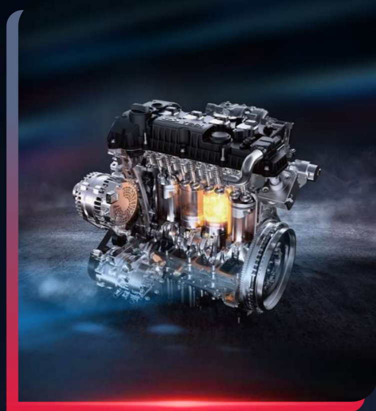
MOTOR 2.0 TURBO

La Jetour X90 PLUS es una SUV completa, gracias a su equipamiento de vanguardia que incluye un motor 2.0 turbo, proporcionando un rendimiento excepcional en todo tipo de rutas.