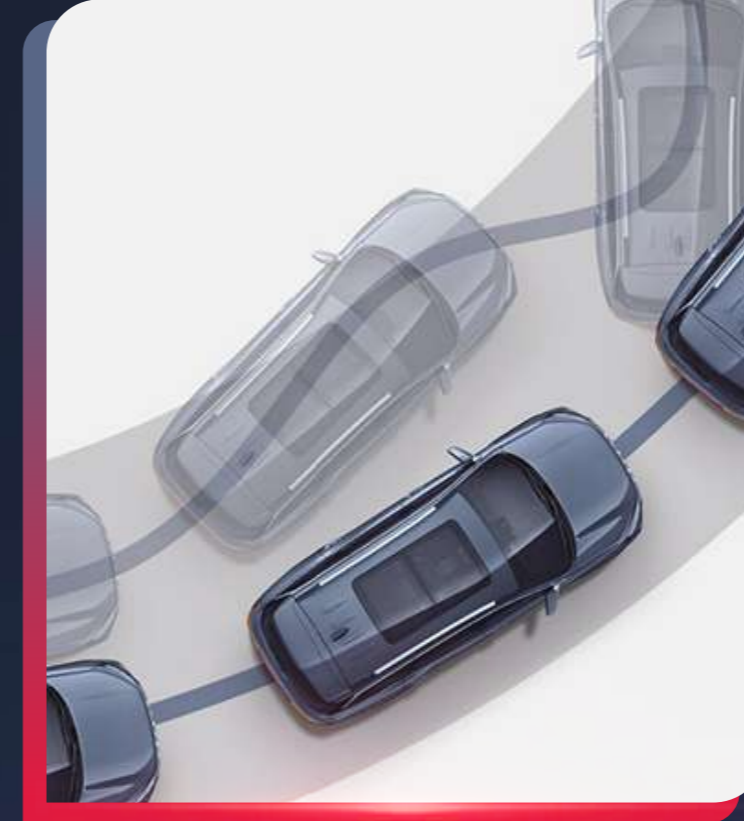
SISTEMA DE CONTROL DE ESTABILIDAD (ESP)